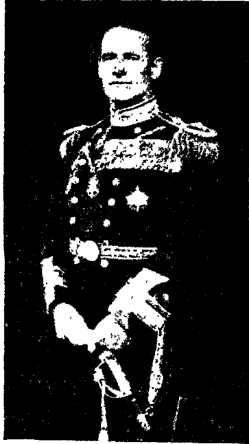
वाइस एडमिरल जी० आर० इवान्स

गये। लाचार होकर वे लोग मोटरोंको वहीं छोड़कर आगे बढ़े। इवान्स अन्तरीपसे रवाना होनेके पहले इन लोगोंको ८०°३०' दक्षिणा अक्षांशके पास कैप्टेन स्काटकी प्रतीक्षा करनेका आदेश दिया